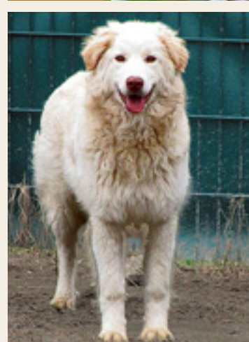
Rino Der Labrador-Retriever-Mischlingsrüde (vier Monate) ist noch ein wenig scheu