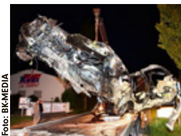
Komplett zertrümmert - der BMW des Unglücksfahrers

Amberg - Nach der Hochzeits-Fete im Sportheim rein in den BMW und nach Hause düsen. Das war keine gute Idee des 29-Jährigen aus Amberg. Der angetrunkene Hochzeitsgast trat ein bisschen zu heftig aufs Gaspedal, raste im Amberger Ortsteil Gailoh von der Straße und frontal gegen einen Baum. Eingeklemmt in das Wrack seines geschroteten Autos starb er noch an der Unfallstelle.