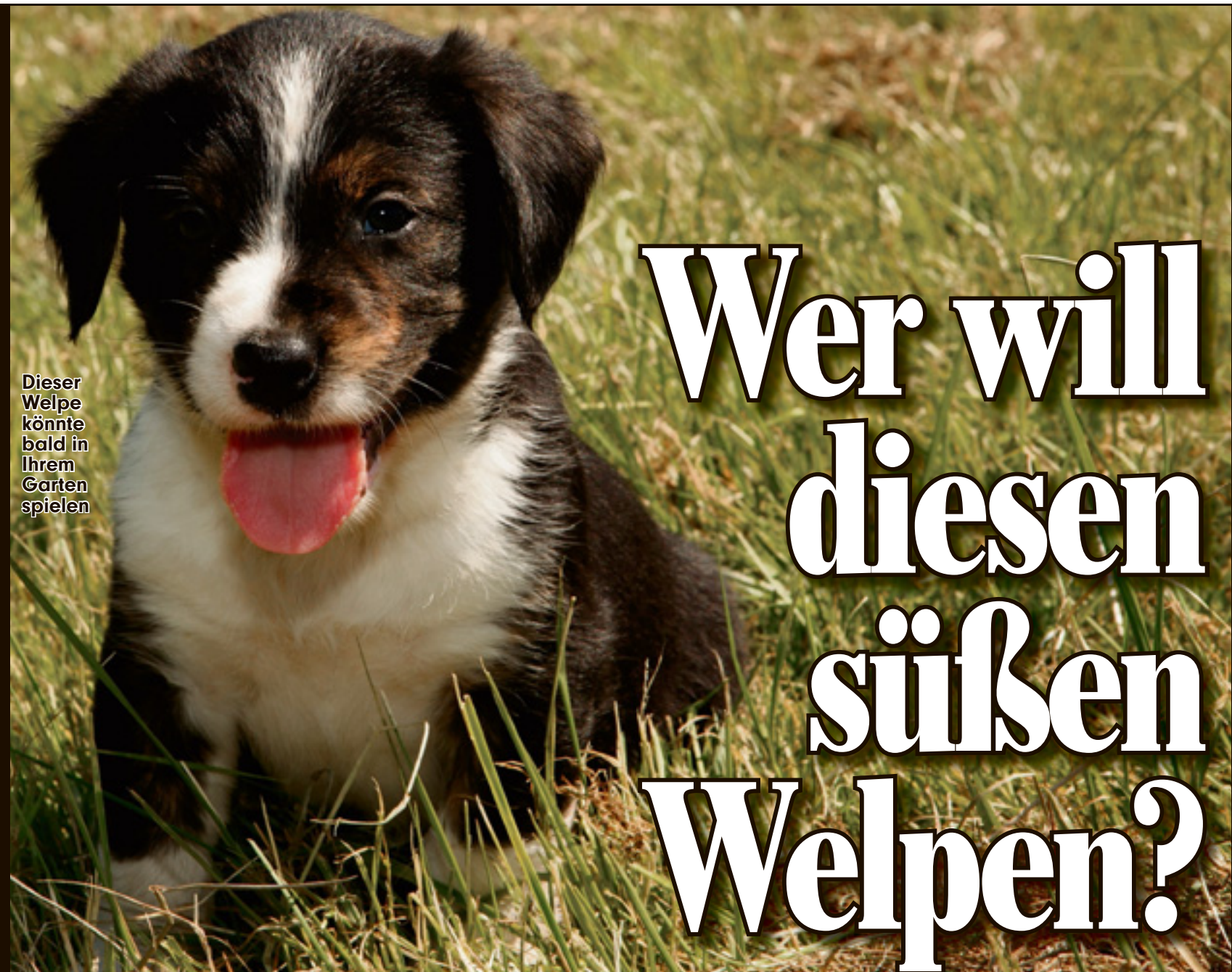
Dieser Welpe könnte bald in Ihrem Garten spielen

Innsbruck - Bei einem schweren Unwetter in Tirol ist am Samstagabend ein ICE der Deutschen Bahn entgleist! Der Zug mit 25 Fahrgästen war von München auf dem Weg nach Seefeld - zum Glück wurde niemand verletzt. Auf Grund der starken Regenfälle war eine Schlammlawine auf die Gleise gegerollt. Die Strecke der Mittellandbahn zwischen Bayern und Tirol blieb bis auf weiteres gesperrt.