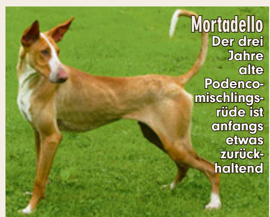
Mortadello Der drei Jahre alte Podenco-mischlingsrüde ist anfangs etwas zurückhaltend