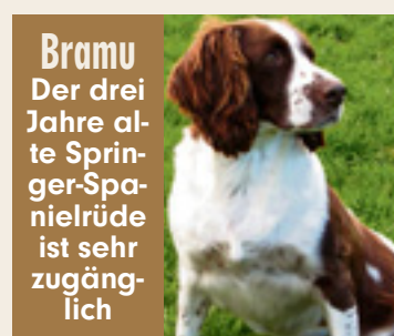
Bramu Der drei Jahre alte Springer-Spanielrüde ist sehr zugänglich

ein Zuhause geben wollen, rufen Sie an unter 08867/92 11 36. Oder fahren Sie zum Sonnenhof nach Rottenbuch (Hochkreit 8). Besuchszeiten sind täglich von 12 bis 16 Uhr. Zudem freut sich SOS Projects für Mensch und Tier e.V. über jede finanzielle Unterstützung. Spendenkonto: 90999, BLZ 70020270, Hypo-Vereinsbank München.