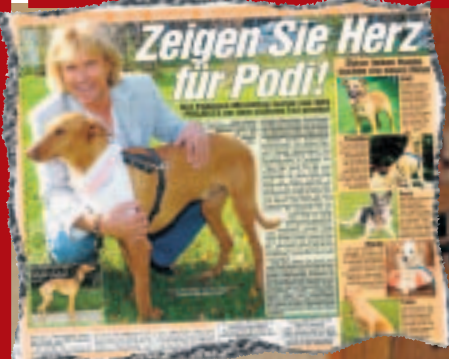
Volksmusik-Star Hansi Hinterseer suchte im April 2005 in BILD München eine neue Familie für Podi