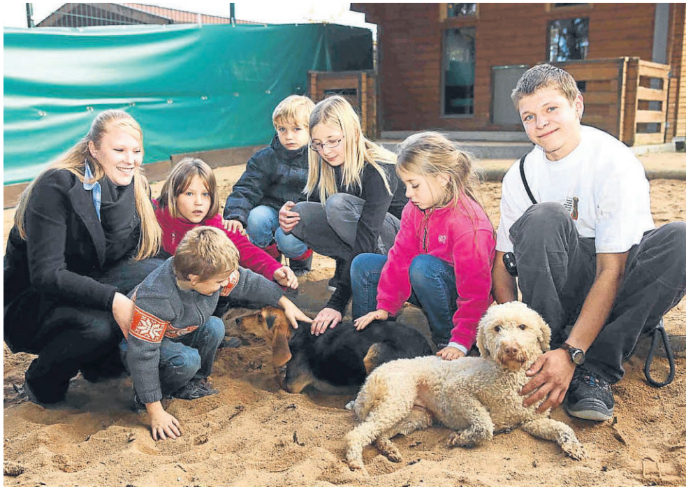
Nach kurzer Einweisung in die „Hundesprache“ durften die Kinder mit den Sonnenhof-Hunden ausgiebig spielen.