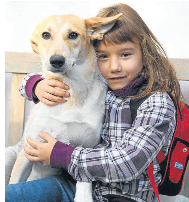
Gesucht und gefunden: Das kleine Mädchen hat diesen Hund sofort ins Herz geschlossen.

Senta (4) wurde von Urlaubern auf einer Müllhalde in Griechenland mit ihren zehn Welpen gerettet. Die kleinen Hunde konnten schon vermittelt werden.